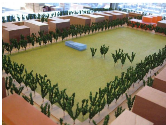
Afb. Impressie sportvelden RI-Oost 24

In het Sportaccommodatieplan 2006 stonden voor het Zeeburgereiland drie voetbalvelden gepland: “Bijzonder binnen het plan is de realisatie van een sportpark nieuwe stijl. Dit sportpark met drie kunstgras voetbalvelden ligt midden in het plangebied.” 22 Nog in 2009 was er sprake van verhuizing van voetbalvereniging Zeeburgia van Middenmeer-Noord naar het Zeeburgereiland. 23 In het bestemmingsplan stond deze impressie van de sportvelden: