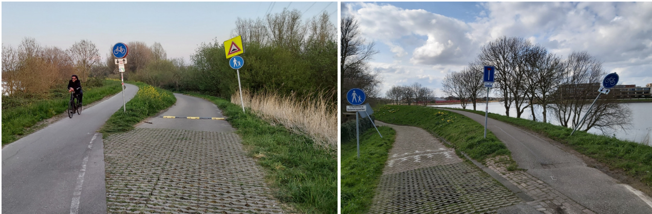
↑ Laatste deel van de 'staart' van het Diemerpark

De Diemerzeedijk met aan de ene kant het IJmeer en aan de andere kant de Derde Diem, is in 'de staart' het dominante landschapskenmerk. Aan weerszijden daarvan is volop natuur te beleven. De ecologische verbindingzone die door de ARK-zone loopt, wordt daar voortgezet.