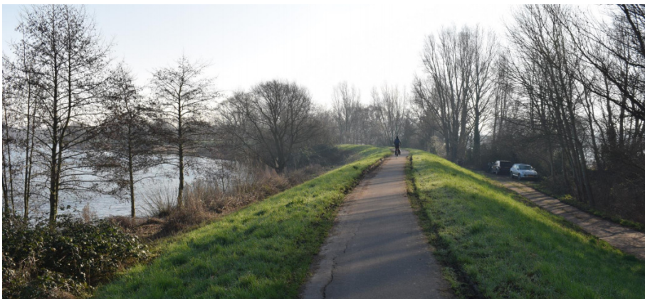
← De Diemerzeedijk in de 'staart' van het park.

Ons bezwaar is vooralsnog namens het College van B&W om procedurele redenen afgewezen. We laten het daar niet bij zitten.