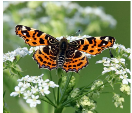
↑ Landkaartje (voorjaarsvorm) Diemerpark 2019

Wie interesse heeft, kan zich alvast aanmelden, want we komen nog een paar mensen tekort!