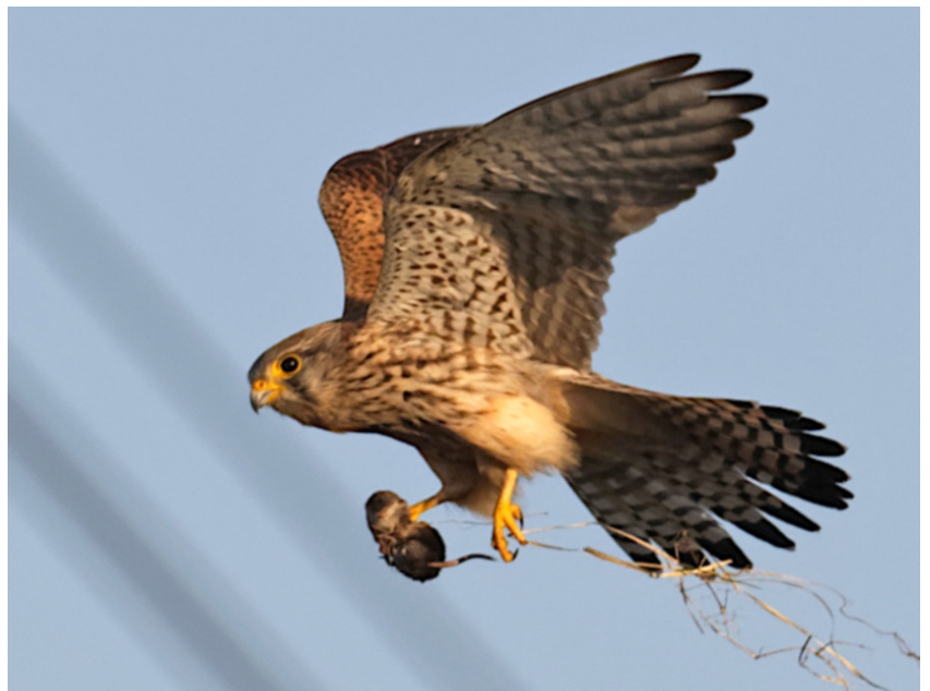
↑ Torenavalk met bosspitsmuis in het Diemerpark, 7 april 2020

Het heeft een tijdje geduurd voor de valken de kast ontdekt hebben: in het broedseizoen van 2018 bleef de kast leeg. Vorig jaar zagen we af en toe een torenvalk in de kast zitten, maar daar is het toen bij gebleven.