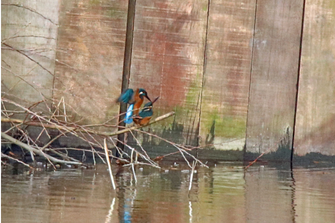
← Parende ijsvogels in het Diemerpark, 18 maart 2020

Ook dit jaar broeden er weer ijsvogels in het Diemerpark! Vorig jaar hadden we vastgesteld dat een broedsel in de wand bij Akkerswade mislukt was omdat de nestwand niet meer in goede staat was: het nest was ofwel uitgegraven door een roofdier (misschien een vos?) ofwel ingestort; daarover bestaat geen zekerheid. Jammer, want er waren al jongen in het nest.