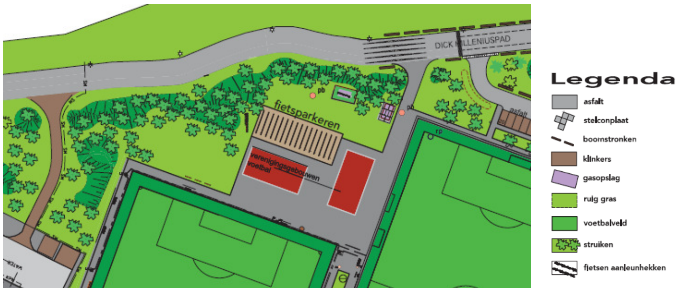
Inrichting rond de tijdelijke accommodatie AFC IJburg 1

De inrichting rond de tijdelijke accommodatie van AFC IJburg zou er volgens dit plan zo uit gaan zien: