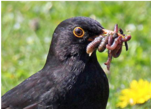
Merelman met maaltje voor de jongen

Ieder jaar, van maart tot en met juni, worden door leden van de Vogelwerkgroep Amsterdam en Vrienden van het Diemerpark de broedvogels in het park geïnventariseerd. Op vijf ochtenden vanaf zonsopgang en op twee avonden vanaf zonsondergang wordt het hele park doorgelopen en worden alle vogels genoteerd waarvan duidelijk is dat ze hier broeden of dat van plan zijn. Tekenen die op broeden wijzen, zijn bijvoorbeeld zang, baltsen (het 'verleiden' van een partner door typisch gedrag), het verzamelen van nestmateriaal, transport van voedsel (zoals rupsen, regenwormen,...) voor de jongen.