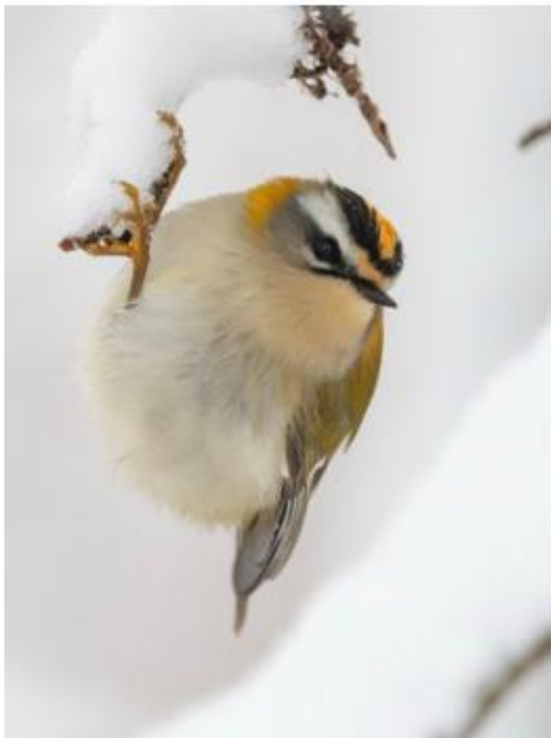
Vuurgoudhaan, 7-1-2026

In het najaar en de winter kun je in het park geregeld goudhaantjes en vuurgoudhaantjes zien. Ze zijn hier uitsluitend buiten het broedseizoen aanwezig, want ze broeden in naaldbossen, die hier ontbreken. Deze soorten lijken erg op elkaar, want beide hebben een opvallende goudgele streep op hun kruin (vandaar 'goud' in hun naam), met aan weerskanten een zwarte streep. Toch zijn ze goed uit elkaar te houden dankzij een paar duidelijke verschillen: de vuurgoudhaan heeft een lichte wenkbrauwstreep en een zwarte oogstreep, in tegenstelling tot de Goudhaan die een licht ringetje rondom zijn oog heeft.