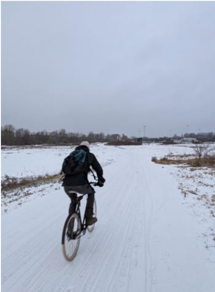
Jan Beijerpad (06-01-2026)

Op 29 januari 2025 stelde de gemeenteraad de Visie Diemerpark vast. Om de daarin opgenomen plannen voor het sportterrein mogelijk te maken, wil het gemeentebestuur binnenkort een Buitenplanse Omgevingsplan-activiteit (BOPA) inzetten. Daarmee kan het college afwijken van het geldende omgevingsplan (vroeger: bestemmingsplan). Het college is in dit geval zowel degene die de vergunning aanvraagt als degene die hem verleent. Het besluit wordt gepubliceerd, waarna iedereen de kans krijgt om zienswijzen in te dienen, bezwaar te maken en in beroep te gaan. We houden dit uiteraard nauwlettend in de gaten.