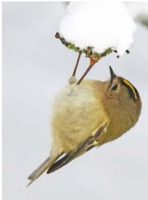
Goudhaan, 5-1-2026

Het goudhaantje is het kleinste vogeltje van Europa: hij weegt tussen 5 en 7 gram. Zijn neef is iets groter. Beide vogels zijn erg beweeglijk, ze zitten geen minuut stil en dartelen van tak tot tak, soms ondersteboven hangend, op zoek naar kleine insecten en spinnetjes.